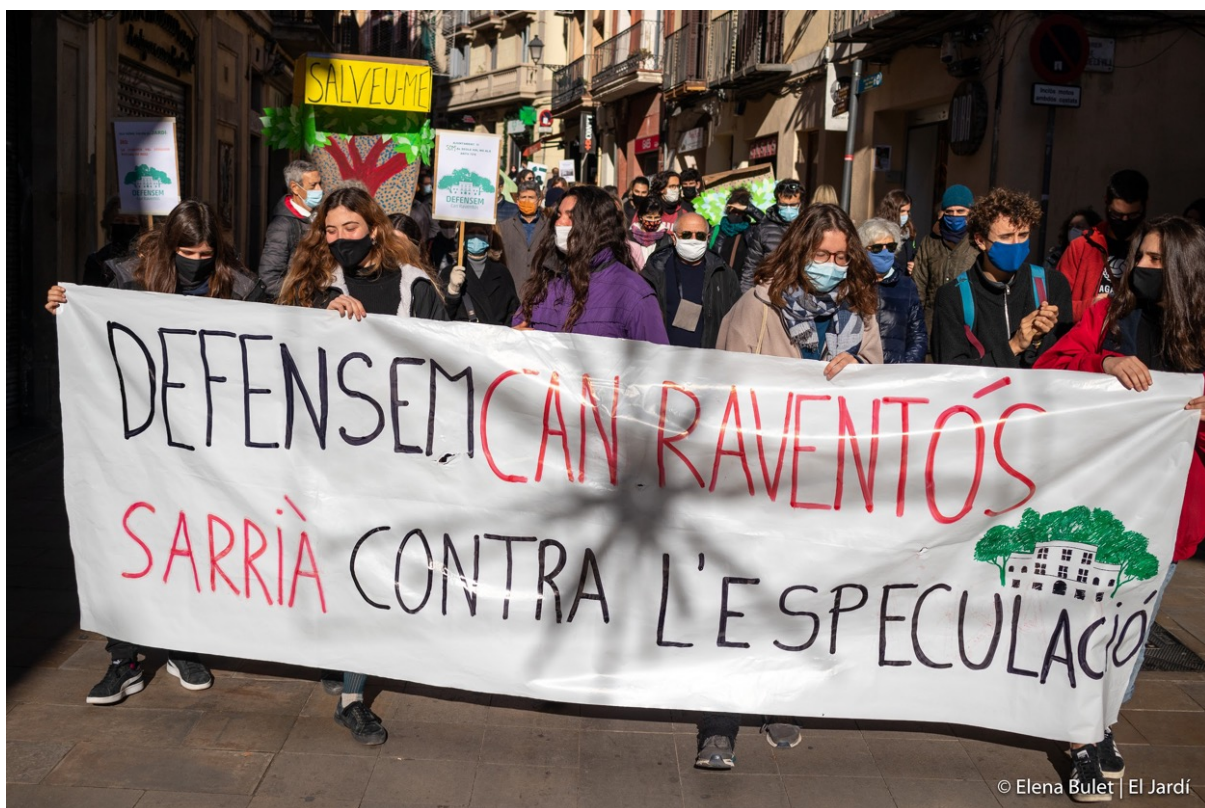
Foto: Manifestació de la Plataforma de Can Raventós

Per tal de cobrir les despeses del procés judicial, va engegar una campanya de micro-mecenatge a través de la plataforma Goteo que va comptar amb un ampli suport veïnal i va recaptar més de 7.000 € a través de petites aportacions de veïns i veïnes.